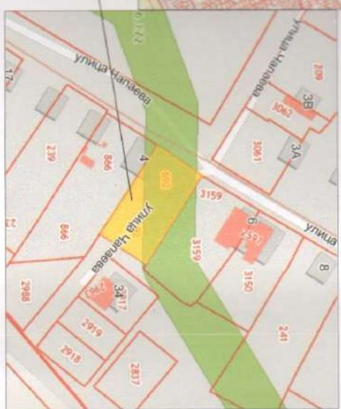
МЕСТО РАЗМЕЩЕНИЯ ЖЕЛЕЗНОДОРОЖНОГО УЧАСТКА